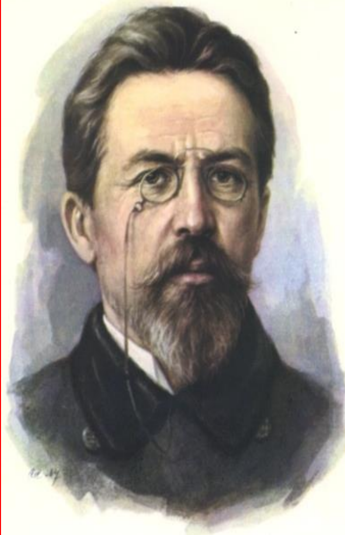
Антон Павлович Чехов (1860—1904)

Мы рождены, чтоб жить на свете долго: Грустить и петь, смеяться и любить. Но, чтобы стали все мечты возможны, Должны мы все здоровье сохранить. Давид Тухманов